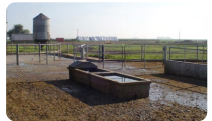
Bebedero ubicado a la salida del tambo.

0,60 m/vacas x 16 vacas = 9,6 metros lineales de bebedero