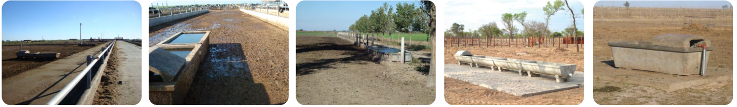
Distintos tipos y disposición de bebederos.

restos de agua en el momento de limpieza.