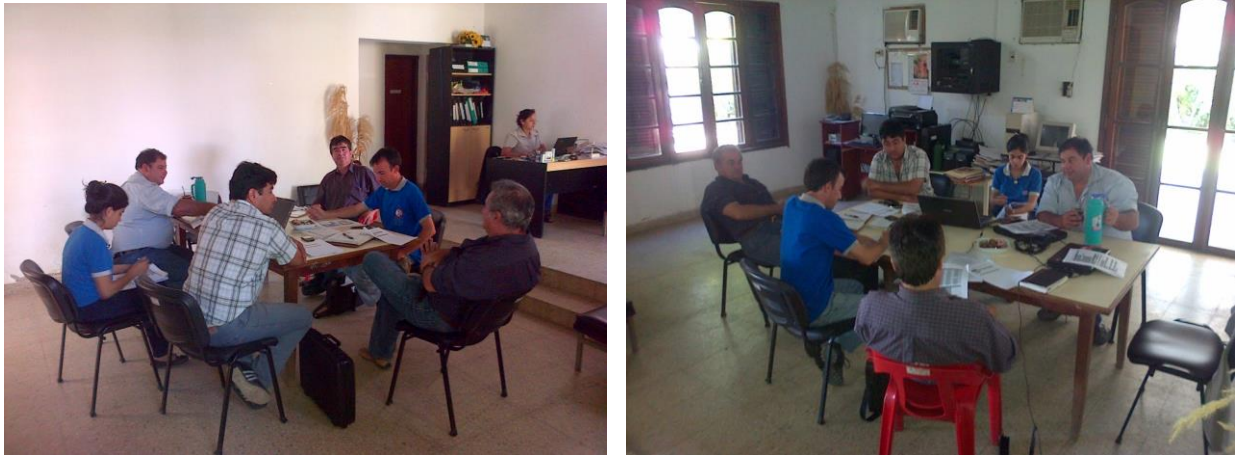
Figura 1. Una de las reuniones de análisis con técnicos de distintas instituciones en INTA AER Laguna Blanca.

cantidad y calidad para su consumo y también para sus producciones agropecuarias. Se acuerda en comenzar con un modelo de relevamiento que irá ajustándose entre todos y validándose en el transcurso de su formulación, como herramienta de diagnóstico que podrá dar cuenta de la realidad hídrica de los AF de la zona en estudio (Puricelli y Moreyra, 2012).