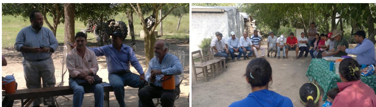
Figura 6. Reunión con la comunidad de Ceibo 13 y Barrio San Martín para analizar las posibilidades de recuperación del estero Pozo Yobay como fuente de agua para una posible distribución domiciliaria.