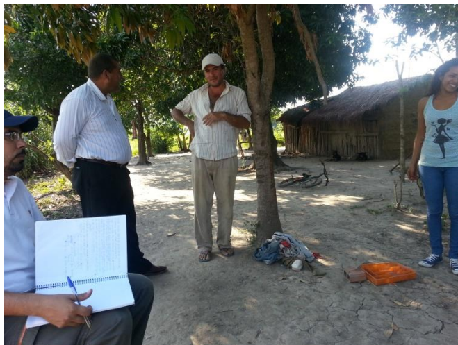
Figura 9. Comienzo de los primeros relevamientos de infraestructura hídrica y situación de acceso al agua.

Durante las reuniones mantenidas con la comunidad se fijaron algunas fechas tentativas para comenzar el trabajo de campo, y que los técnicos participantes del relevamiento pudieran visitar los hogares de los AF incluidos en ésta cuenca para ir completando las encuestas. Una vez que se comenzó con el proceso de relevamiento en sí mismo (figura 9) se fueron obteniendo interesantes resultados, los cuales se encuentran hasta la fecha en proceso de análisis pero que van mostrando algunas tendencias esperables que se mencionan en la próxima sección.