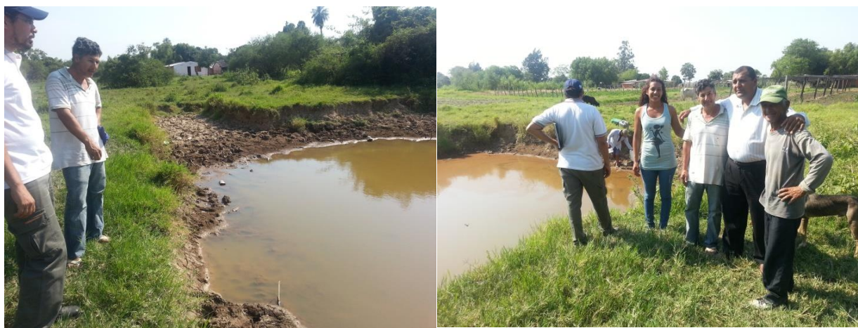
Figura 10. Represa alimentada por camiones cisterna municipal, utilizada con fines domiciliarios, inclusive consumo humano.

Según lo extraído parcialmente de las encuestas realizadas, aproximadamente un 80% de la población relevada se encuentra con alguna situación deficiente en cuanto al acceso al agua. Esto concuerda con discusiones mantenidas durante el proceso de conformación de las encuestas en la mesa de gestión de la AER Laguna Blanca del INTA. En la figura 10 se puede ver uno de los tantos ejemplos típicos, siendo éste un caso paradigmático, de irregular acceso y uso del recurso hídrico,