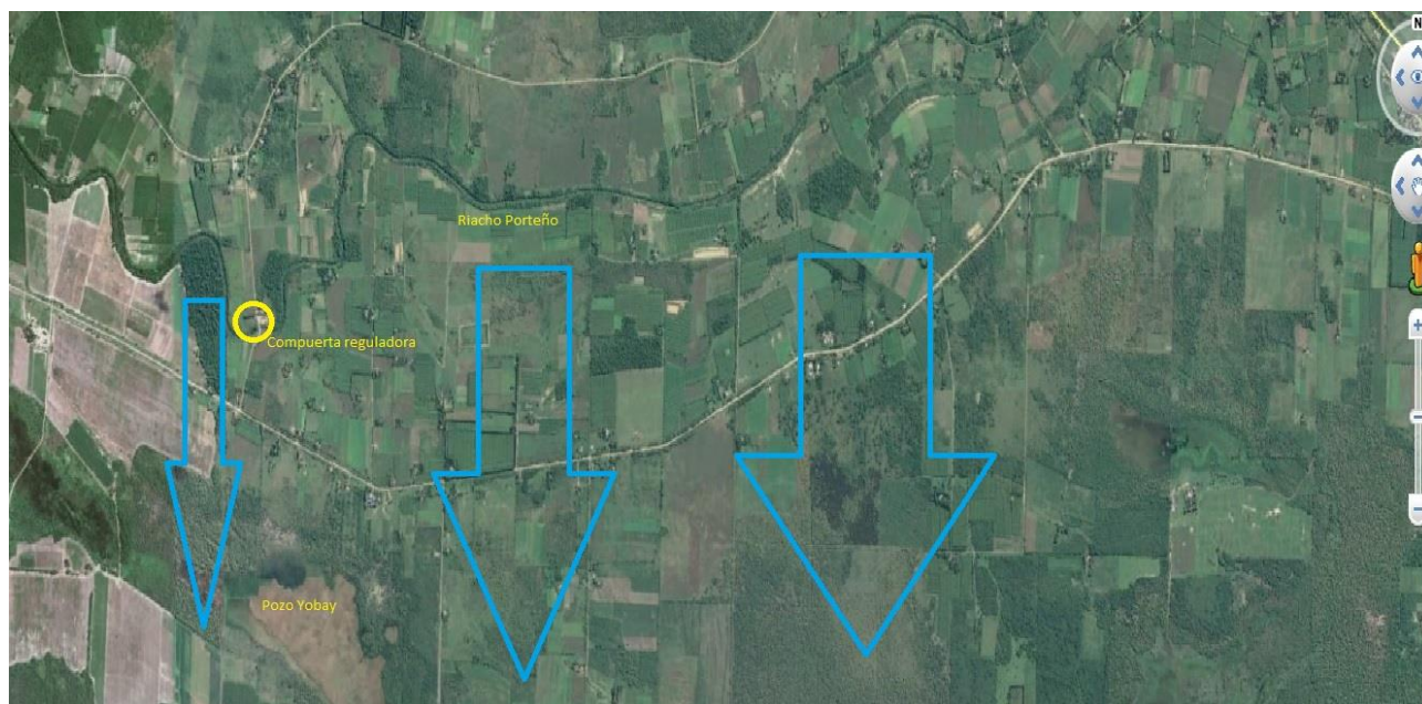
Figura 2. Imagen satelital de Google Earth de la zona en estudio donde se remarca la ubicación del riacho Porteño, la posición de una compuerta reguladora de nivel, la ubicación del estero Pozo Yobay, y la dirección de escurrimiento del agua superficial representado por las flechas azules.