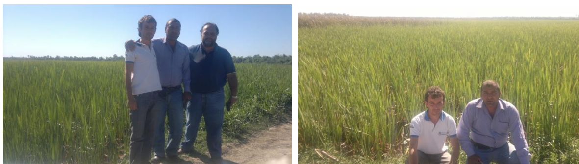
Figura 5. Recorrida de técnicos hidrólogos para observar el estero Pozo Yobay.

Para terminar con el relato de la idea propuesta por la A.T.Y.P., en la figura 5 se puede apreciar someramente la extensión del Pozo Yobay, el cual tiene una superficie aproximada de 25 has. En esa oportunidad, técnicos hidrólogos recorrieron la zona para constatar la ubicación y extensión de éste espejo de agua natural, y para conversar con la comunidad las posibilidades existentes para la realización de algún proyecto de inversión (figura 6).