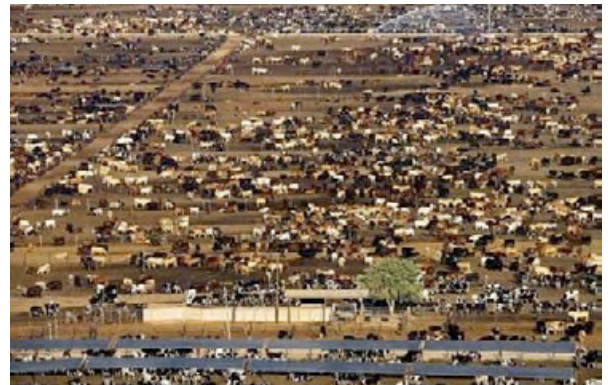
Figura 1. Cría de bovinos en sistema de producción intensivo.

Durante su evolución los bovinos aprendieron a obtener los recursos brindados por el hombre –comida,