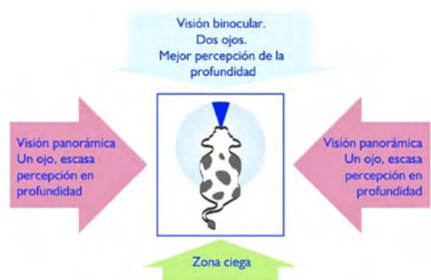
Figura 4. Diagrama de visión del bovino.

Considerando el concepto de bienestar animal podemos enumerar algunas acciones y beneficios al aplicarlo: las buenas técnicas de manejo mejoran el crecimiento y desarrollo de los animales, reduciendo dolor, miedo y reacciones fisiológicas de estrés provocadas por el manejo inadecuado. El suministro de dietas apropiadas y de suficiente agua potable contribuye a mantener la salud y productividad de los animales. Proporcionar condiciones de vida adecuadas a los bovinos puede disminuir la incidencia de comportamientos perjudiciales o anormales. Ambientes, instalaciones y equipos seguros y confortables pueden prevenir lesiones y pérdidas productivas. Al proporcionar espacio adecuado se evitan pérdidas productivas y muertes relacionadas con la superpoblación o hacinamiento. La mejor atención de los criadores o engordadores para con sus animales posibilita el diagnóstico precoz de enfermedades, de disminución de la producción y de