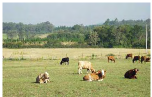
Figura 2. Cría de bovinos en sistema de producción extensivo.