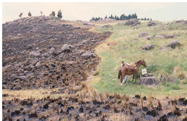
Limite de la quema de un pastizal natural en el Parque Chaqueño Serrano (La Barranquita, sierra de Comechingones, Cba., 1100 msnm).