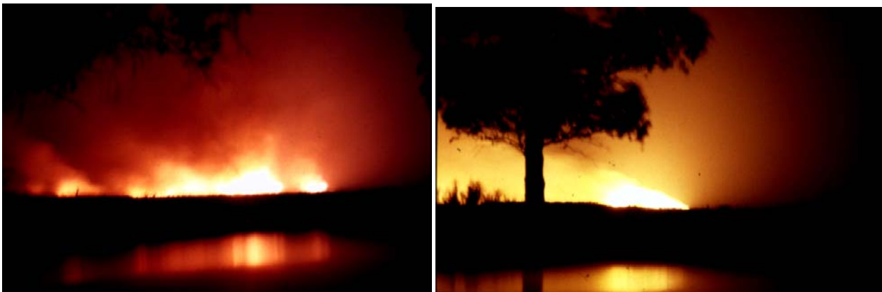
Impresionante imagen nocturna de un incendio en la sierra del Parque Chaqueño serrano (sept.de 1983; fotos tomadas desde ruta Nac. N° 8, en Vizcacheras, limite interprovincial Córdoba-San Luis).