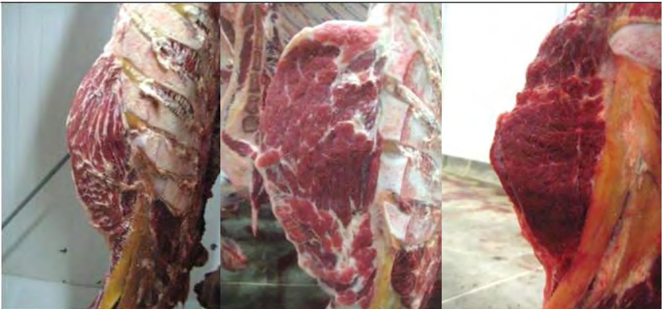
Figura 2: Puntuación del engrasamiento de la giba. Adaptado de USDA Quality Grade