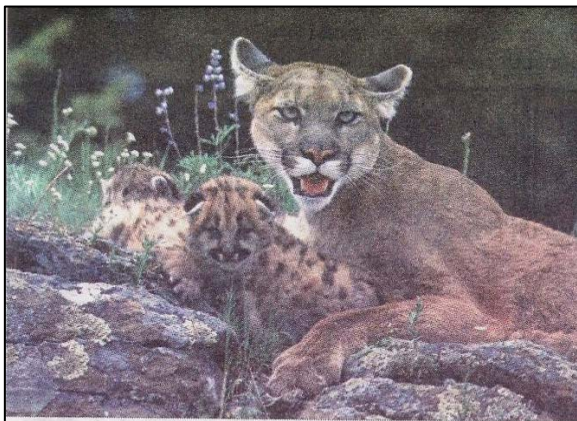
Por la tarea de aprendizaje de la caza, las pumas con sus crías son más dañinas que los machos para la hacienda.

"Cada tanto teníamos algún ataque y perdíamos una o dos ovejas, pero una vez vino una puma con sus cachorros y nos mataron como 20 animales para comerse uno solo", afirmó, para mencionar que desde entonces no dejan ni una oveja fuera del corral por la noche. "Si quedan algunas sueltas, algún puma las mata, a pesar de que estamos a más de 1.000 metros del arroyo Santa Catalina, que debe ser el lugar más cercano que tienen para esconderse, ya que los campos de nuestros vecinos están dedicados de lleno a la agricultura", afirmó, para destacar que además le pusieron luces al corral porque al ser un animal de hábitos nocturnos también evitan los lugares iluminados. Este efecto, aparentemente, es tan eficaz como las dimensiones y la estructura del corral montado en el campo universitario.