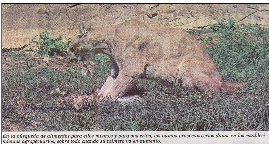
En la búsqueda de alimentos para ellos mismos y para sus crías, los pumas provocan serios daños en los establecimientos agropecuarios, sobre todo cuando su número va en aumento.

Para el ruralista, los ataques de los pumas son fuente de pérdidas importantes y obligarán a los productores a tomar algunas medidas, un tema que a su juicio también debería ser tomado en cuenta por las autoridades de la provincia de Córdoba, ya que la caza del puma está prohibida por la Ley provincial 8789, siendo la Agencia Cór-