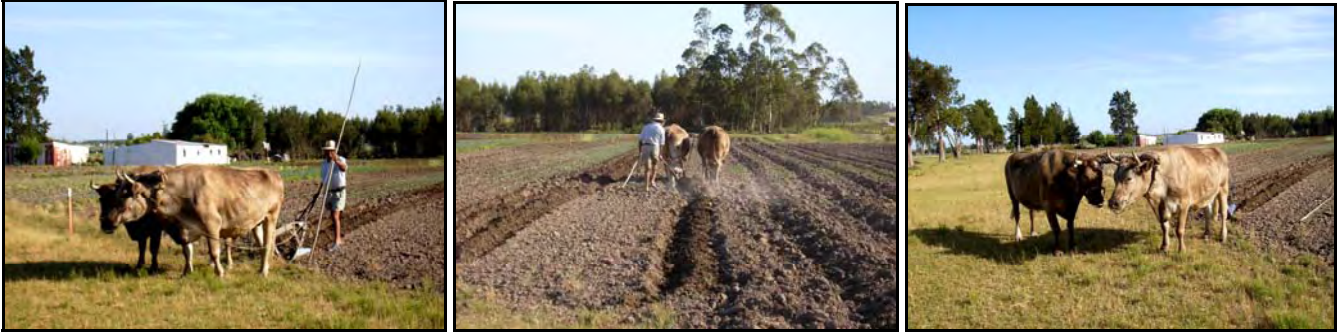
Bueyes uncidos a un arado. R. O. Uruguay.