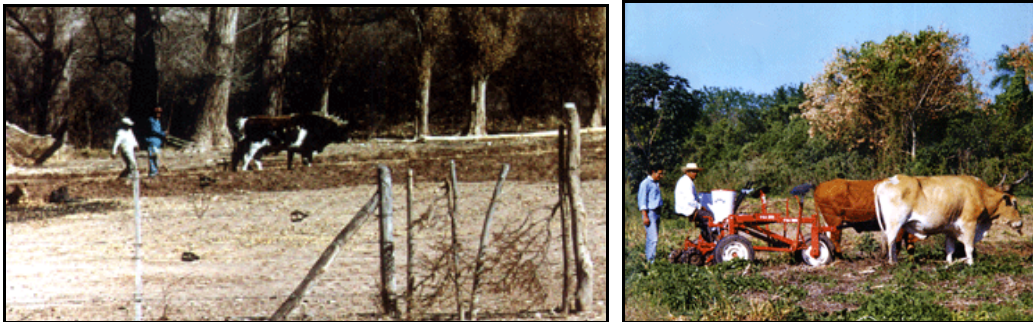
a)-Buey arando en la Quebrada de Humahuaca, Argentina. b)-Moderna sembradora tirada por dos bueyes Criollos con sangre cebú.