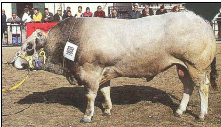
Toro raza Piemontesa, Exp. Palermo 2000