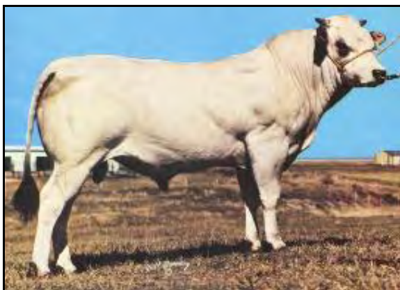
Torito raza Piemontesa

CARACTERÍSTICAS: Astada, pelaje corto color canela, mucosas oscuras, marcado desarrollo muscular, magra, ojos pigmentados, borla negra, rústica.