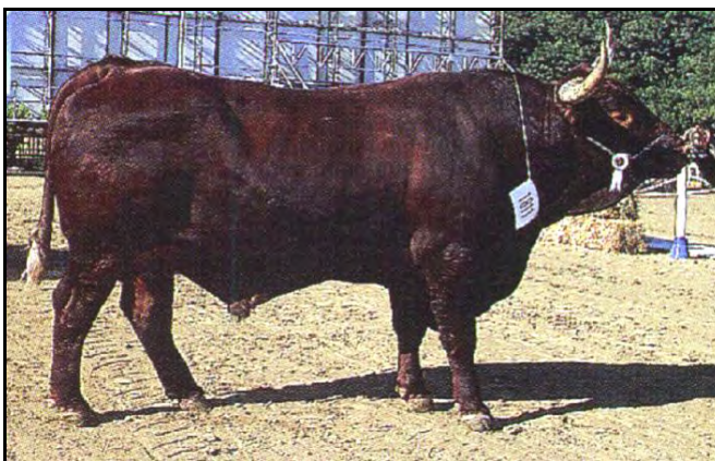
Toro raza Retinta, Exp. Palermo 2000

CARACTERÍSTICAS: Pelaje rojo, con tonalidades que varían desde la más oscura (retinta) hasta las más claras (colorada y rubia), con una degradación del color alrededor de los ojos (ojo de perdiz), mechón de la cola blanco y mucosas rosadas. Rústica, se adapta a serranías y zonas bajas pantanosas. Facilidad al parto. Longeva.