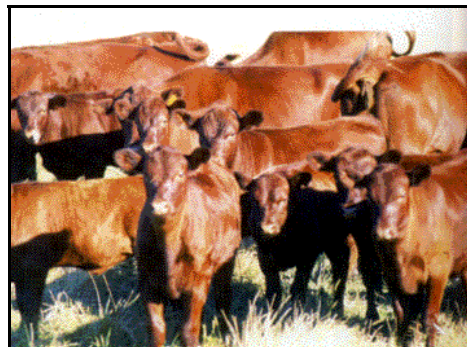
Estancia Tatay: a) En 1936, primer tambo mecanizado de la Argentina con Red Polled. b) En 2005, ejemplares puros de Red Polled.

Volver a: Razas bovinas en general > Curso P.B.C.