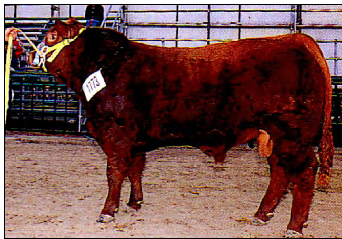
Toro Limangus colorado, Exp. Palermo 2000

Pelaje colorado o negro. El colorado puede tener aureolas más claras alrededor del morro, ojos, vientre, extremidades y periné (se admite el hosco y el pangaré). De pelo liso corto, adaptado al calor del norte argentino.