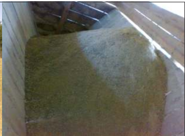
Comedero de autoconsumo con balanceado comercial utilizado en el ensayo