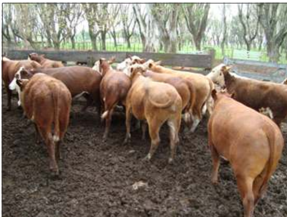
Lote de novillos terminados

Sampedro y Maidana, 2011. Hoja Informativa N° 49. EEA Mercedes.