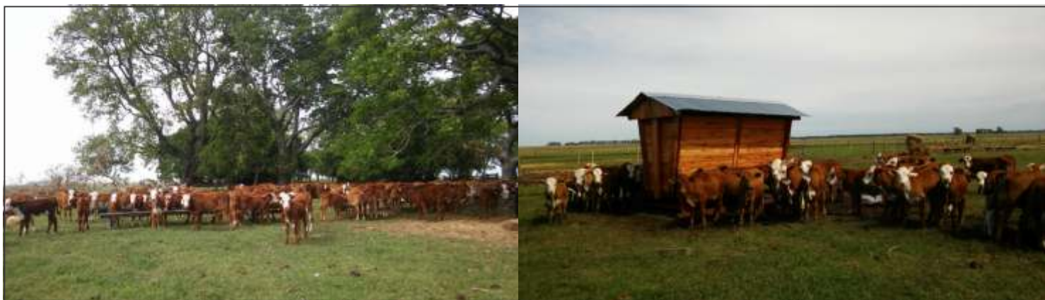
Terneros destetados precozmente en la etapa de adaptación y con comederos de autoconsumo

Los resultados que se muestran (Cuadro 2) son de 2 años de alimentación con comederos de autoconsumo en terneros destetados precozmente de ambos sistemas de cría existentes en la EEA INTA Mercedes. En todos los casos se lograron terneros de igual o mejor peso que los destetados convencionalmente en los sistemas.