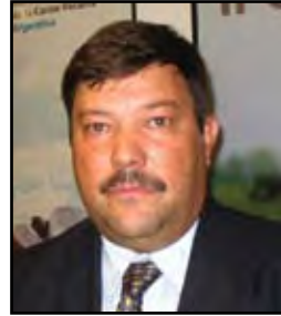
Por Dardo Chiesa Presidente del IPCVA

Aunque un poco menguada por las últimas lluvias, la sequía que padece todo el país está produciendo un golpe mortal para muchos productores. Más de 2.000.000 de animales muertos, contando cifras del norte santafecino, Chaco, Formosa, Santiago del Estero, Córdoba, La Pampa, Buenos Aires.