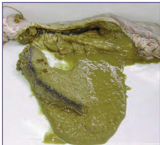
Foto 4: Cuajo de ovino con presencia de cenizas en el contenido, que se observan de una tonalidad oscura.

4. Problemas digestivos: al estar los pastos cubiertos de cenizas, los animales están ingiriendo una cantidad importante de la misma, que puede ser mayor en las áreas donde aún no ha llovido y menor donde los pastos han sido “lavados” por la lluvia. La acumulación y pasaje de cenizas por el tracto digestivo de los animales genera alteraciones de distinto tipo. Hasta el presente no se han reportado diarreas en ovinos, aunque sí se ha detectado la presencia de cenizas (partículas muy pequeñas de color negro) en el contenido del aparato digestivo en lanares de consumo (Foto 4) y cambios en el color de la mucosa o pared interior de los órganos digestivos. En el caso de los ovinos, hay que estar atentos, porque un cambio en la dieta como la que ha generado la erupción volcánica, sumada a la suplementación con forraje y granos que se está implementando, puede desencadenar en brotes tempranos de Enterotoxemia (Foto 5). En Bovinos se han reportado casos de diarreas y muerte súbita, sin embargo no se ha podido comprobar hasta el presente si se deben al accionar directo de las cenizas o a una determinada enfermedad infecciosa. En equinos se han reportado casos de cólicos y posterior muerte de los animales.