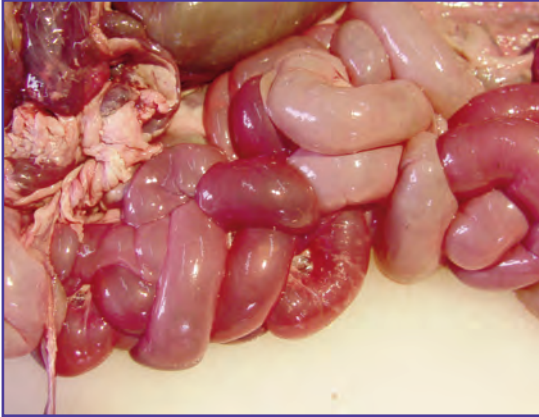
Foto 5: Intestino enrojecido y con acumulo de gas en un caso de Enterotoxemia.

5. Producción de abortos: en el caso de los ovinos puede ser algo ocasional y de hecho no se han reportado casos. En el caso de los caprinos se han registrado diversos casos de aborto, debido a que dicha especie reacciona de esta manera ante situaciones graves de stress alimenticio o climático, como la que se está viviendo en la región. En este caso también sería importante el diagnóstico diferencial de abortos producidos por stress, a los abortos por causas infecciosas, como son Brucelosis , Campylobacteriosis , Salmonelosis , Leptospirosis , Toxoplasmosis , etc.