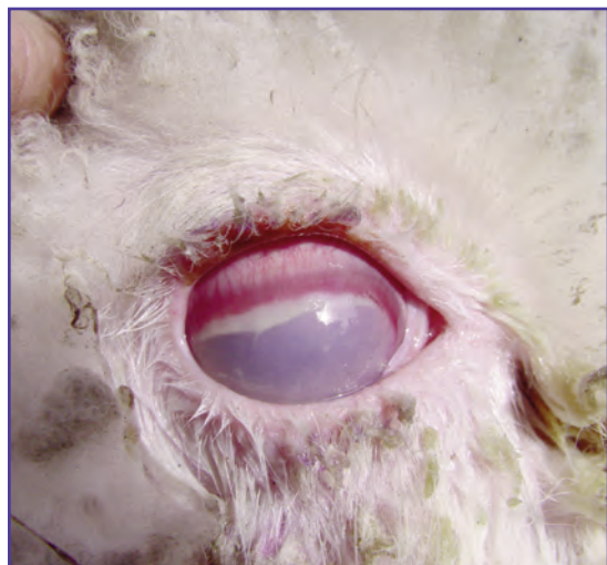
Foto 2b: Animal con Queratoconjuntivitis o "Ceguera" donde puede observarse el ojo afectado.