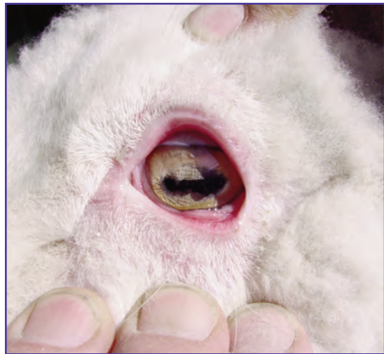
Foto 2a: Conjuntiva irritada y enrojecida por el efecto de las cenizas.

alimentación del ganado. Ante la presencia de problemas oculares severos se recomienda realizar un diagnóstico diferencial entre lo que pueden ser las lesiones irritativas por un efecto mecánico de las cenizas, de la enfermedad conocida como Queratoconjuntivitis o Ceguera (Foto 2b), que es producida por agentes infecciosos. De esta manera se podrá recomendar el tratamiento adecuado.