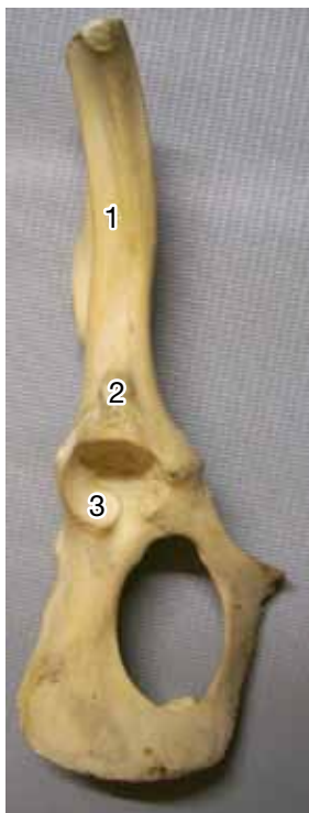
Figura 6. Coxal: cresta glútea (1), tubérculo para recto femoral (2), cavidad acetabular (3).