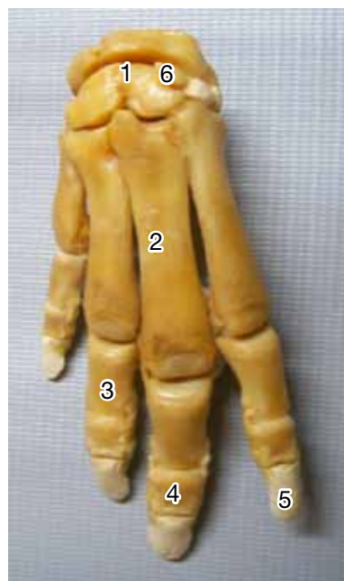
Figura 5. Mano: carpo (1), metacarpo (2), falange proximal (3), falange intermedia (4), falange distal (5), carpo central (6).

El extremo proximal de la ulna fue voluminoso, con una escotadura semilunar amplia. El olécranon era tricúspide. En la extremidad distal, el proceso estiloides articuló con los huesos carpo ulnar y carpo accesorio (Figura 3). Entre la ulna y el radio existió en todo el largo, un espacio interóseo. El carpo estaba constituido por ocho huesos dispuestos en dos filas, la proximal compuesta por tres huesos: el escafolunatum (carpo radial intermedio), el carpo ulnar y el carpo accesorio. El escafolunatum era el más voluminoso y medial, la superficie articular proximal era amplia y se articulaba con la tróclea distal del radio. El carpo accesorio, dirigido caudalmente formó parte de la pared lateral del