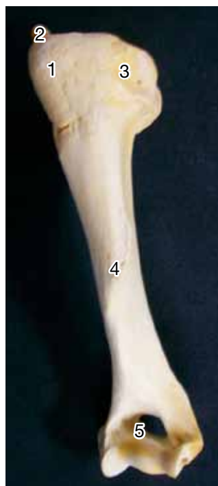
Figura 2. Húmero: tub.mayor (1), hueso sesamoides (2), fosa musc. infraespinoso (3), tub.deltoidea (4), agujero supratrocLEAR (5).