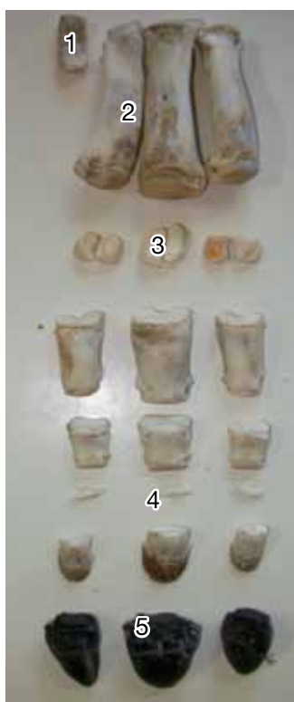
Figura 10. Metatarsiano I (1), metatarsianos II, III, IV (2), sesamoides proximales (3), sesamoides distales (4), pezuña (5).

unió al trocánter mayor mediante la cresta intertrocanterica bien definida, que delimitó una fosa trocantérica profunda, donde se apreció un agujero hacia lateral. El trocánter mayor era cuadrilátero y sobrepasó levemente la altura de la cabeza. Los labios de la tróclea eran