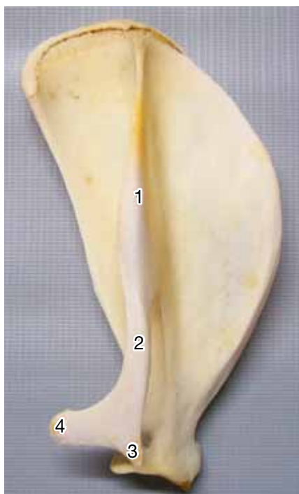
Figura 1. Cresta escapular (1), acromion (2), proceso hamatus y suprahamatus (3 y 4).

El cuerpo del húmero fue comprimido lateralmente, con una convexidad craneal (cresta humeral) y a nivel del tercio medio presentó la tuberosidad deltoidea, en medial se observó una leve depresión que reemplazó a la tuberosidad teres. En la extremidad proximal, el tubérculo mayor fue muy desarrollado y desplazado hacia medial, no sobrepasando el nivel de la cabeza. En