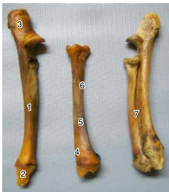
Figura 3. Ulna (1), proceso estiloides (2), olécranon (3), radio (4), cara palmar (5), surco (6), espacio interóseo (7).