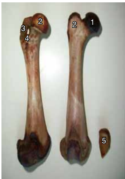
Figura 7. Fémur: cabeza (1), trocánter mayor (2), cresta trocantérica (3), agujero cresta troc. (4), patella (5).

presentó forma irregular, aplanado lateralmente y articuló con el primer carpiano y la extremidad proximal del II metacarpiano, en palmar del extremo proximal se ubicaron cuatro huesos sesamoideos (Figura 5).