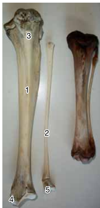
Figura 8. Tibia (1), fíbula (2), tuberosidad tibial (3), maléolos tibial y fibular (4, 5).

En el fémur la cabeza representó un segmento de esfera con un cuello manifiesto, el trocánter 3º estaba poco desarrollado y se ubicó en el tercio medio del borde lateral, el trocánter menor se ubicó en caudal y se