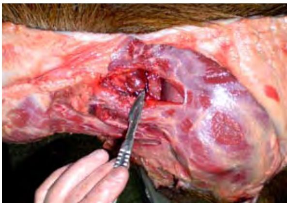
Figura 3. Nódulo linfático cervical superficial.

aritmética y desviación estándar. Los hallazgos fueron documentados fotográficamente.