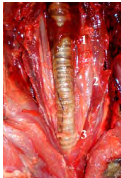
Figura 4. Nódulos cervicales: profundo craneal (1), profundo medio (2) y profundo caudal (3).

Nódulos linfáticos cervicales superficiales (Figura 3): dos a tres nódulos de forma ovoide, de 20,6 \pm 1,3 mm, situados en proximal de la unión escápulo humeral, sobre el borde craneal del músculo pectoral pre-escapular, cubiertos por el músculo braquiocefálico, entre éste y el músculo serrato cervical, en el trayecto de la vena cervical superficial.