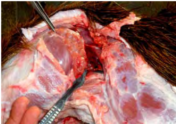
Figura 2. Nódulo parotídeo.