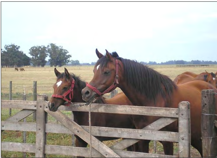
Yegua con potrillo