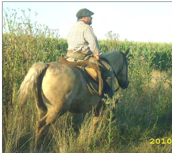
Caballo de trabajo