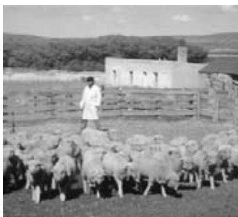
● Inspección a campo de lote de corderos certificables.

No se puede hablar del cordero patagónico como una generalidad. Cada zona de esa extensa región tiene sus propias características agroambientales que determinan diferentes tipos de pastizales naturales, sistemas de producción y prácticas de manejo que, a su