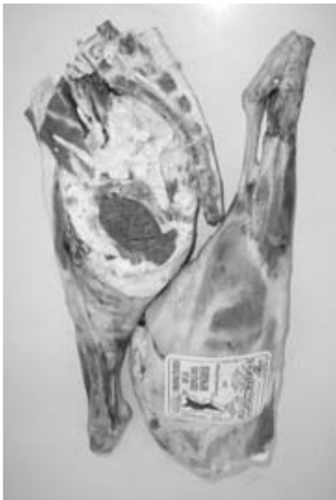
● Pierna de cordero preparada en corte para la alta cocina.

Este es un camino que se ha comenzado a transitar, que está dando sus primeros frutos y del cual se espera que pueda redundar a futuro en un beneficio considerable para los productores de esta apartada región de nuestro país. ●