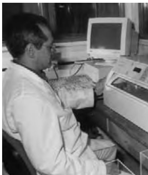
● Mediciones adicionales en lana: Determinación de largo de mecha, resistencia a la tracción y punto de quiebre. Laboratorio de Lanas Rawson. Gobierno del Chubut - INTA.

Desde el punto de vista industrial, el largo de la mecha incide fuertemente en el largo medio de fibras en la lana peinada (Altura Media o Hauteur del Top). Este parámetro tipifica la materia prima para la hilandería y junto con el diámetro de las fibras define el precio final de la lana peinada. Representa el promedio de longitud de las mechas en el lote y se mide en milímetros (mm). El error del método de ensayo es del orden de 4 mm.