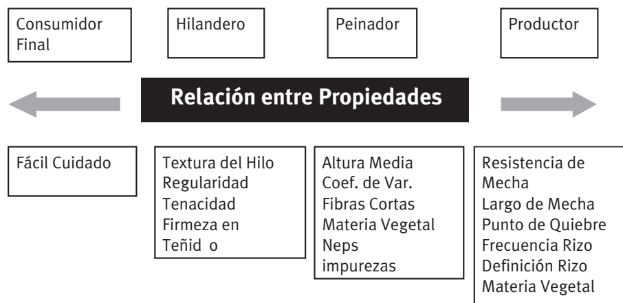
● Figura N° 1: Relación entre las características de lanas sucias y algunas de las etapas posteriores.