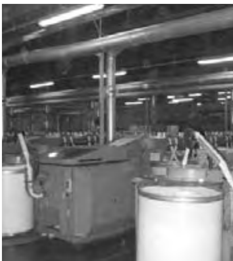
● Sector Peinaduría de lanas.

textiles y su caracterización sean más exigentes. Por ello, la lana sucia en el mercado australiano ya lleva incorporadas mediciones objetivas que se refieren al color, residuos de pesticidas, coeficiente de variación del diámetro medio, factor de confort y ondulación, entre otras. ●