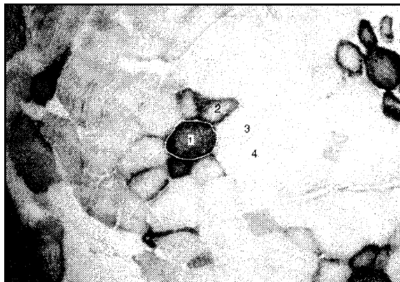
Figura 2: Obtenida a partir de una muestra del Músculo Longissimus dorsi de cerdo, tratada mediante la reacción de ATPasa, a pH 4,6: 1. fibra tipo I; 2. fibra tipo HA; 3 y 4. fibra tipo IIB. Material original producido por los autores.

Con respecto a las características metabólicas, se distinguen tres tipos de fibras: oxidativas, intermedias y no oxidativas. Las fibras oxidativas usan glucosa y grasa como sustrato para generar energía mientras que las fibras no oxidativas son glicolíticas y contienen más glucógeno; las intermedias presentan ambas características (29; 7). La reacción NADH tetrazolium reductasa permite diferenciar estos tipos metabólicos, según se muestra en la Figura 2.