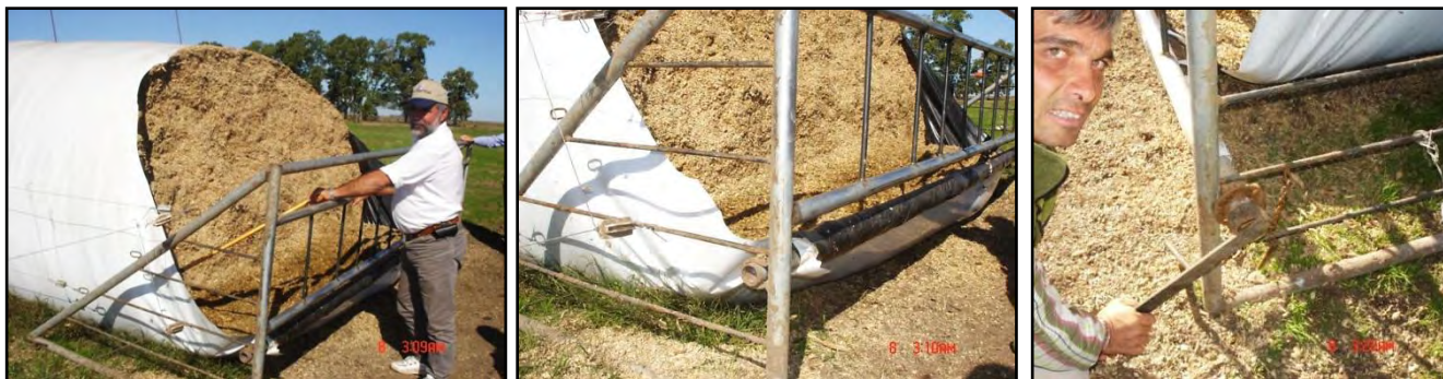
a y b) Vistas generales del sistema. c) Detalle de la manivela y de la rueda dentada con traba para hacer girar el eje. Al girar el eje tracciona la jaula hacia el silo tirando del piso, con lo que con una ayuda de empuje, se logra colocarlo en su nueva posición a medida que el silo es consumido por los animales.