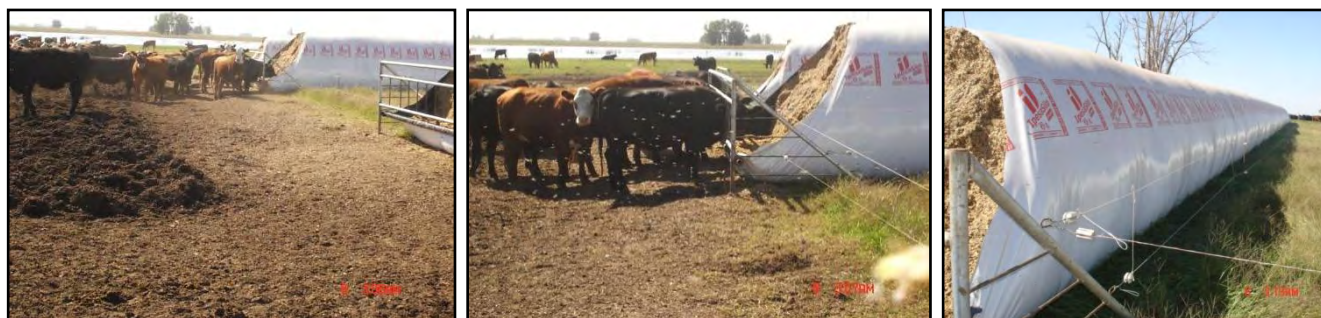
a) A la izquierda se ve una zona con barro seco, pero sin desperdicio de silo, producido cuando llovieron 100 mm y los animales se paraban en ese lugar para consumir. Hoy el consumo ha ido avanzando en el silo, y se ve el suelo seco y sin desperdicio. Por la cantidad de animales, hay tres silos abiertos simultáneamente. b y c) Observar el alambre eléctrico que afirmado en las jaulas impide el paso de los animales hacia atrás del lugar de abertura del silo. En c) ver también dos hilos eléctricos paralelos al silo protegiéndolo de algún animal que pueda haber traspasado el primer alambrado eléctrico.