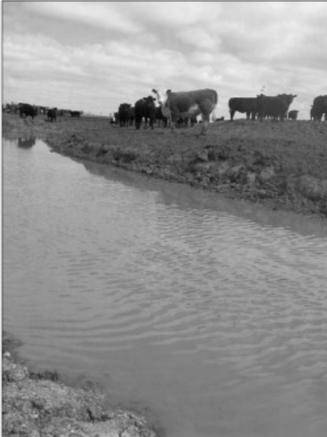
➤ Los feedlots concentran gran cantidad de animales en poca superficie.

afectando el resto de la cadena trófica. Pueden ser excretados intactos, o parcial o totalmente metabolizados en orina y/o heces.