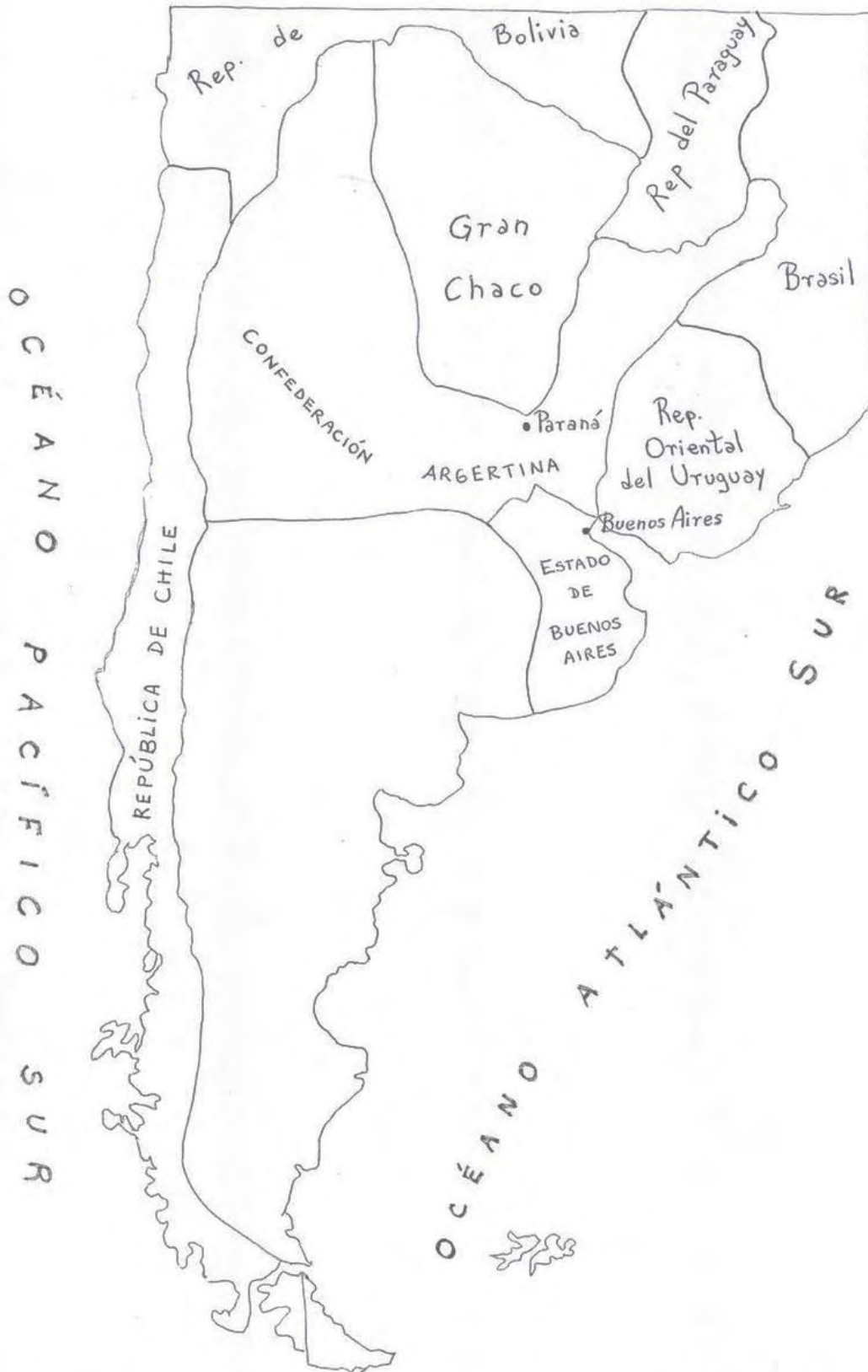
Territorio ocupado por La Confederación Argentina y el Estado de Buenos Aires 1852 - 1861