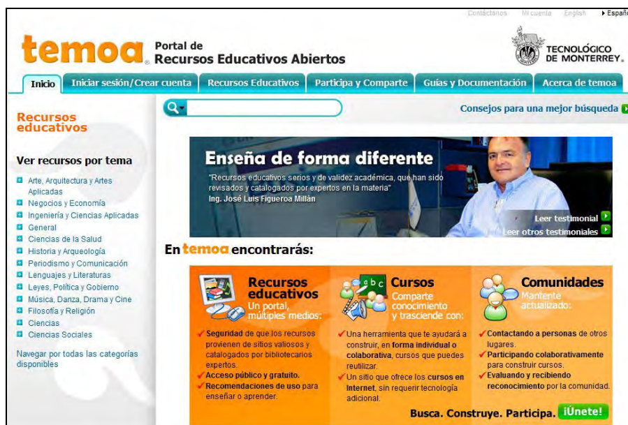
Figura 2. Portal de Recursos Educativos Abiertos (Temoa, 2010)

El portal de Recursos Educativos Abiertos temoa ® busca indizar la mayor cantidad de materiales educativos de todo el mundo y de muy distintas fuentes a través de una categorización de sitios web que proveen de REA en sí mismos (Temoa, 2010). Tal es el caso de fuentes académicas de distintas instituciones de educación superior que publican cursos completos (OCWC, 2010; OLI, 2010; OYC, 2010; NPTEL, 2010), así como de organizaciones de la iniciativa privada, entidades gubernamentales, centros de información, entidades digitales dedicadas a la divulgación de conocimiento y organizaciones sin fines de lucro. El portal pudiera considerarse un “distribuidor de conocimiento” a través de su catálogo de REA.