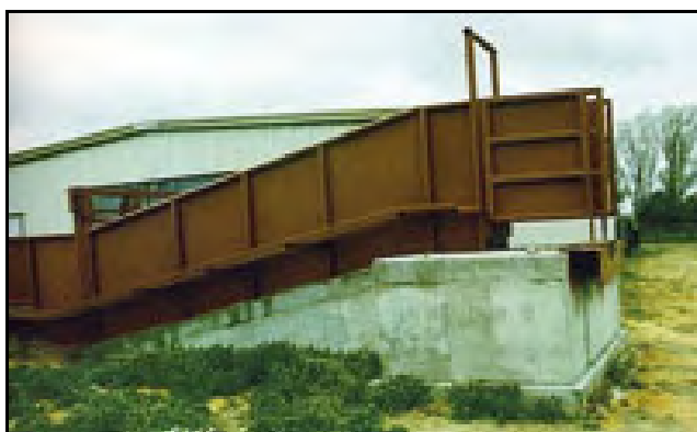
a)-Embarcadero cerrado, con final llano.

"Las paredes de las mangas de trabajo de una sola fila, las rampas de embarque y los corrales de encierro deben ser cerrados. Con ello se evita que el ganado se distraiga. Los animales se rehusarán a avanzar si la manga parece un callejón sin salida. Las puertas corredizas deben construirse con tubos, a fin de que el ganado que se aproxima vea animales al otro lado, estimulando la conducta de seguimiento.