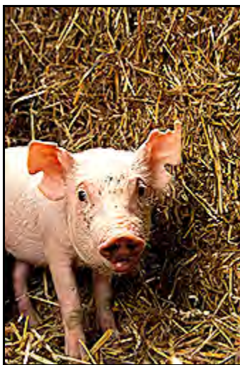
Un estudio de ARS se fijara en la socialización de cochinitos con la esperanza de prevenir peleas entre los cerdos cuando ellos maduran.

Trabajando con colegas de la Universidad de la Florida en Gainesville, Eicher descubrió que entremezclar los terneros tratados con el suplemento con terneros de otras manadas no era tan estresante como destetarlos o transportarlos. Como indicadores, los científicos usaron los comportamientos de los animales, niveles de cortisol en la sangre, proteínas de hígado, otras proteínas, y indicadores del sistema inmune como IgC.