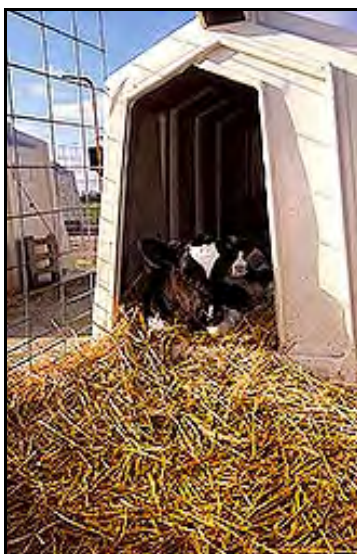
La manera en que el ganado ve el mundo es el foco del trabajo de los científicos de ARS que estudian el comportamiento del ganado. Los investigadores esperan identificar y reducir el estrés excesivo del ganado para mejorar la salud y productividad de los animales.

Como parte de los estudios de Eicher sobre los efectos de métodos agrícolas en los sistemas inmunes del ganado, ella ha desarrollado un suplemento de fórmula lechera que ayuda a los terneros lecheros a combatir Salmone-lla y otras infecciones, particularmente durante los períodos de estrés.