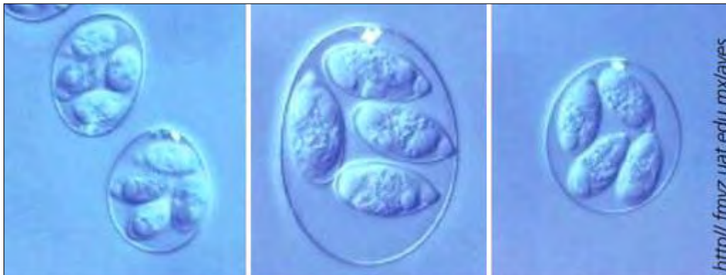
Oocistos de distintos tipos de Eimeria spp.

Eimeria spp. ingresa en el hospedador penetrando en las células epiteliales de la mucosa intestinal causando severos daños a la integridad física del intestino. En general, los animales jóvenes son más susceptibles a la infección y presentan signos de la enfermedad rápidamente, mientras que las aves adultas parecen relativamente más resistentes a la infección.