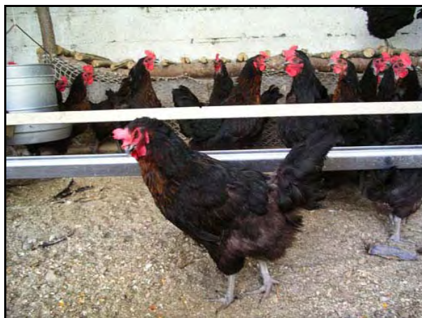
Gallina negra INTA

El presente artículo tiene como propósito difundir datos locales de productividad de la Negra INTA y brindar información para el suministro de luz artificial -necesaria para asegurar una postura sostenida- en granjas o gallineros del noroeste provincial.