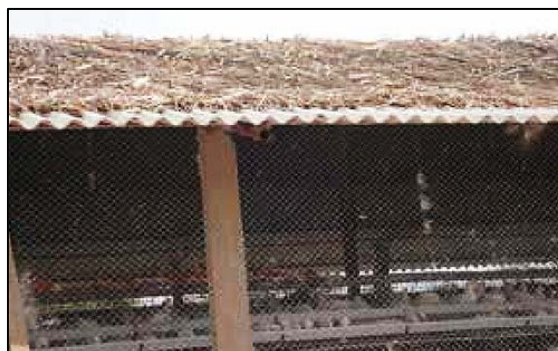
Figura 2. Utilice paja (paja, tallos de maíz, caña de azúcar) para reducir el calentamiento del techo