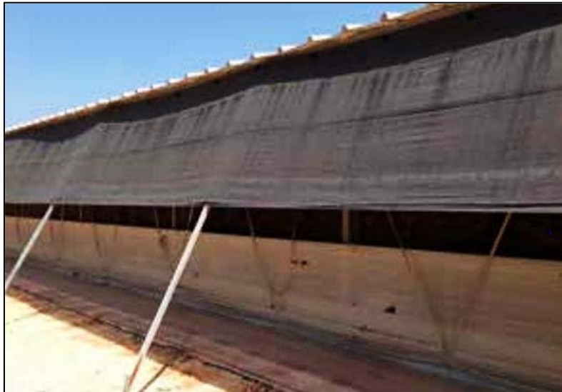
Figura 3. Las cortinas porosas bloquean la luz directa del sol dentro del galpón, pero permiten que pase el aire.