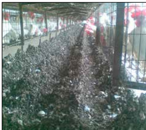
Figura 4. La acumulación de gallinaza reduce la ventilación en las jaulas.