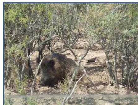
Hembra con cría al pie, en cría extensiva.

El fin de los rayones que se crían extensivamente en uno de los lotes junto con las hembras, sería la extracción cuando llegan a un peso aproximado de 70 kg para el abastecimiento de una chacinadora de la zona.