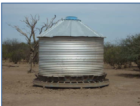
Silo para alimentación en el extremo de un corral.

Tanto el criaderos para chacinados como uno de los cotos de caza, realizan la cría semi-intensiva, es decir, una parte de la vida del animal transcurre en los corrales y otro en lotes para su esparcimiento. Y el coto restante que cría también ejemplares de la especie, lo hace de manera totalmente extensiva, solo influyendo en la vida del animal, en la colocación en amplios corrales, divididos por un lado hembras y rayones, y por otro, machos. También en cuanto al suministro de alimento 3 , el cual se realiza mediante silos ad vivitum (cuanto quieran) y provisión de agua.