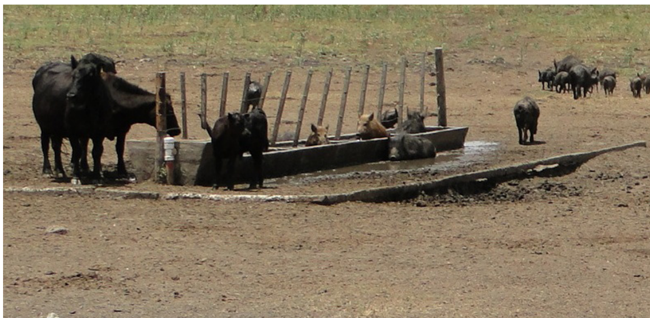
Foto: Cerdos cimarrones interactuando con el ganado bovino en la Bahía de Samborombón.

El jabalí o cerdo silvestre es posiblemente la especie de la fauna con mayor relevancia sanitaria para la salud del hombre y de los animales domésticos. Ello se debe a su amplia distribución geográfica y su abundancia creciente, pero sobre todo al hecho de tratarse del pariente silvestre o asilvestrado del cerdo doméstico, y de una especie cuya carne es aprovechada para el consumo. Es ampliamente reconocido que las poblaciones de cerdos silvestres actúan como reservorios altamente móviles de una serie de enfermedades transmisibles al hombre y a los animales domésticos. Entre las enfermedades más comúnmente encontradas en poblaciones de cerdos silvestres se encuentra la brucelosis porcina (Giovannini et al. , 1988; Van Der Leek et al. , 1993a), pseudorabia (Van Der Leek et al. , 1993b; Zupancic et al. , 2002), Peste Porcina Clásica (Zupancic et al. , 2002), triquinosis, enfermedad de Aujeszky y tuberculosis.