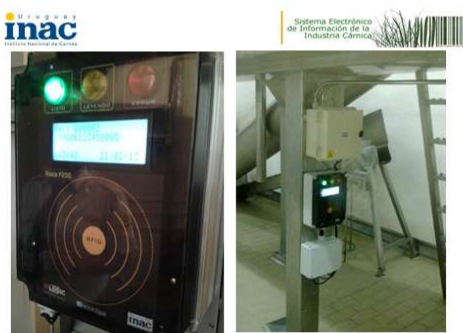
Lectores en Frigoríficos

Mediante el empleo de lectores de caravanas, desarrollados por INAC en conjunto con una empresa uruguaya, se identifica cada una de las reses bovinas que ingresan a la faena. El número de caravana leída se registra en una base de datos que se integra a la base general del SEIIC correspondiendo uno a uno la lectura con los registros de cada res.