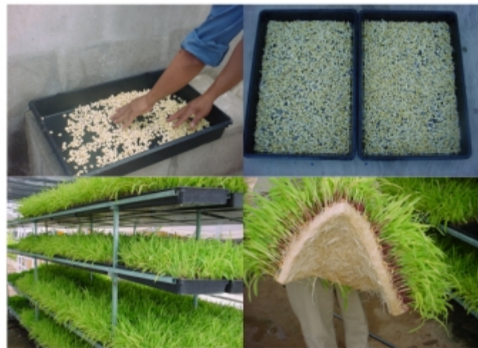
Figura 1. Sistema básico de producción de Forraje Verde Hidropónico (FVH) de maíz (Proyecto FUNDACIÓN PRODUCE, BCS "Estrategias genéticas, nutricionales y sanitarias para incrementar los indicadores de rendimiento y calidad de la cadena productiva de caprinos en BCS".

En México, aproximadamente el 60% del territorio está conformado por zonas áridas y semiáridas localizadas principalmente en la parte noroeste del país (Rivera-Aguilar et al., 2004) en donde en los últimos años la actividad agropecuaria se ha incrementado notablemente no obstante de la aridez y prolongadas sequías que las caracterizan. Como caso tipo, el Estado de Baja California Sur es uno de los más áridos de México, en el cual las escasas precipitaciones y abatimiento de mantos acuíferos son fenómenos comunes que limitan severamente el desarrollo de la ganadería (Espinoza et al., 2007). Las tecnologías que se emplean generalmente para producir alimento para el ganado no son las apropiadas para estas zonas lo cual ocasiona problemas de contaminación del suelo y mantos acuíferos (Endo et al., 2000), agotamiento de agostaderos y extinción de especies de flora nativa (Villaseñor et al., 2007). Por las características naturales de las zonas áridas y semiáridas, y por prácticas agronómicas mal empleadas, el cultivo de especies forrajeras como alfalfa, avena y maíz reportan un Uso Eficiente del Agua (UEA) muy bajo, produciendo de 1.5 a 3.0 kg de materia seca por cada m 3 de agua de riego utilizado (Chaves y Davies, 2010). Por lo tanto, la implementación de sistemas de producción de alimento para el ganado con bajo consumo de agua y de fácil adaptación en zonas desérticas es fundamental para el desarrollo de una ganadería sustentable.