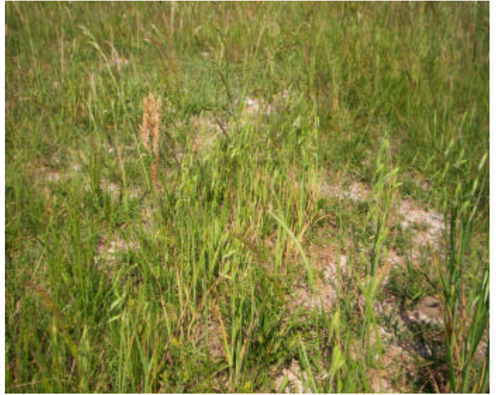
Parte de abajo es el lote de la experiencia