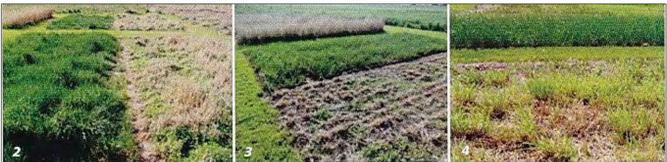
Foto 2: Izq. adelante, agropiro Tobiano-INTA. Derecha grama rhodes enmalezada a la salida de invierno. Atrás centro, agropiro Tobiano-INTA en el primer crecimiento primaveral. Atrás der. e izq., grama rhodes. 21 de setiembre 2011. Campo Experimental GAPP, Pergamino.

Foto 3: Al fondo grama rhodes a la salida del invierno. Centro, Agropiro Tobiano-INTA en el segundo crecimiento primaveral. Adelante, grama rhodes desmalezada anticipadamente. 19 de octubre de 2011. Campo Experimental GAPP, Pergamino