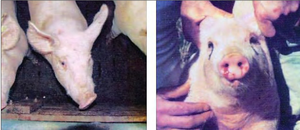
Desviación lateral de hocico (izquierda) y cerdo con hemorragia nasal. (Foto: Atlas de Patología y clínica porcina. D. Barcellos, J. Sobestiansky y D. Driemeier)

Por lo tanto, tiene más interés el cultivo a partir de hisopados nasales o amigdalinos para intentar el crecimiento tanto de B. bronchiseptica como de P. multocida . Para intentar demostrar la presencia de la dermonecrotina, se usa la prueba ELISA “sándwich”, en la que por medio de anticuerpos monoclonales antitoxina de P. multocida se pone de manifiesto la presencia de cepas de la bacteria productoras de toxina. Recientemente, se están incorporando técnicas de PCR que permiten un diagnóstico más sensible y específico.