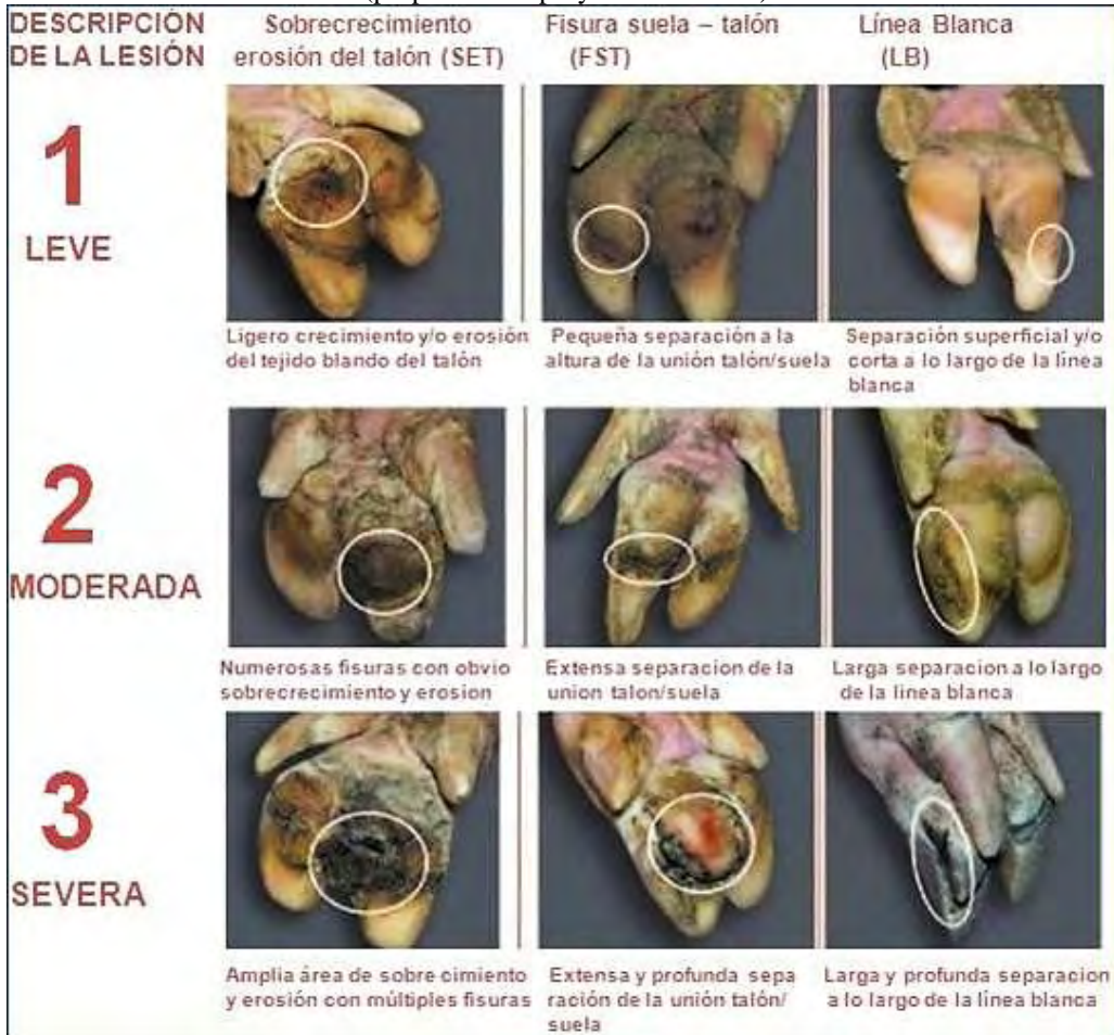
Figura 1.- Tabla de clasificación de las lesiones en función de su gravedad y el lugar donde se localizan