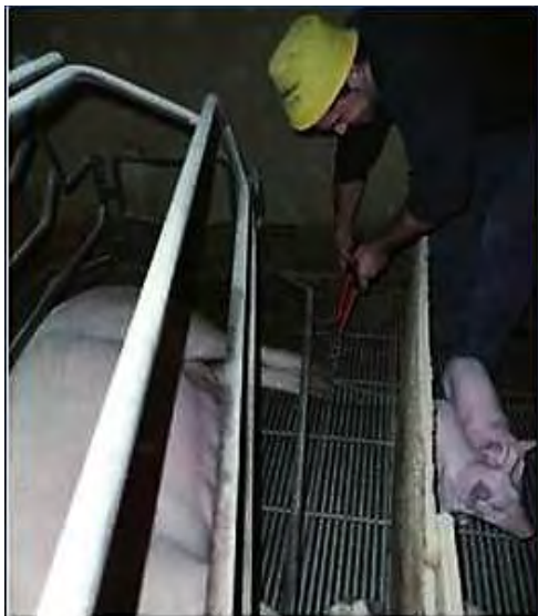
El recorte de pezuñas se realiza en las salas de maternidades, cuando la cerda está tumbada.

En todas las granjas, a los 5-6 meses de complementar los piensos con complejos de microminerales quelado de zinc, cobre y manganeso, observamos una clara disminución de grado de lesión de las pezuñas y de la incidencia de cojeras.