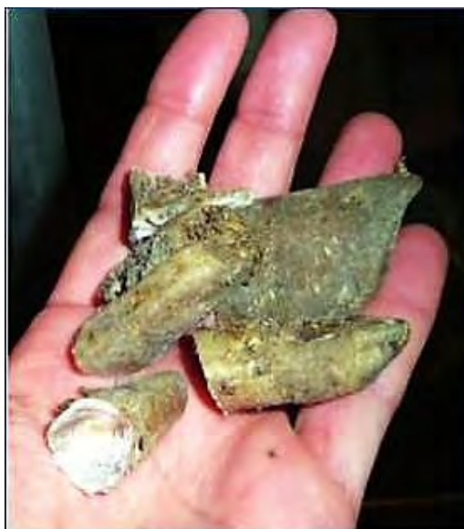
Trozos de pezuña después del recorte.